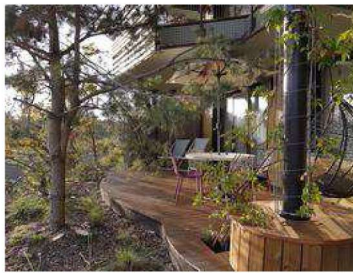
Appartement du village avec sa terrasse arborée.

Même l'Aqualagon, imposante structure de verre et de métal créée par un autre architecte, Jacques Ferrier, avec ses bassins intérieurs et extérieurs (dont l'eau est chauffée toute l'année à 30°C par géothermie), ses 6 toboggans géants, son mur d'escalade et sa piscine à vagues, accueille 5000 m2 de serres. On y trouve une grande variété d'arbres exotiques (figus, barringtonias, ylang-ylangs, frangipaniers...) que Thierry Huau est allé choisir lui-même en Thaïlande avant d'être acclimatées aux Pays-Bas, pour recréer l'atmosphère des forêts tropicales humides.