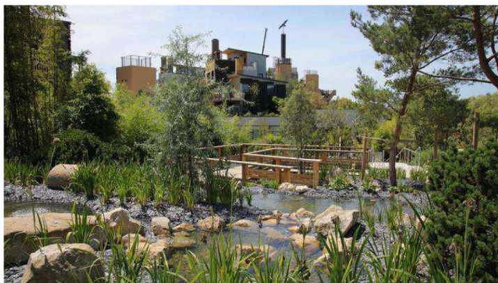
Vue sur les «Jardins extraordinaires» de Villages Nature. Paul MAURER

Par Marc Mennessier | Mis à jour le 27/11/2017 à 10:42